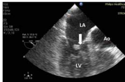
Εικ. 2. Μεσοοισοφάγεια επιμήκης τομή, καταδεικνύουσα προπίπτουσα μάζα (βέλος), δια του στομίου της μιτροειδούς